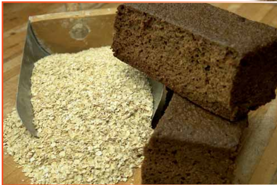
Vi dyrker i dag stærkt forædlede hvedesorter, som et stigende antal mennesker ikke tåler, fordi de ikke kan nedbryde dem helt.